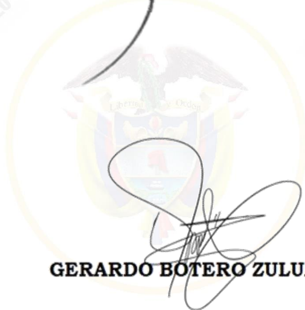
GERARDO BOTERO ZULUAGA

República de Colombia Corte Suprema de Justicia